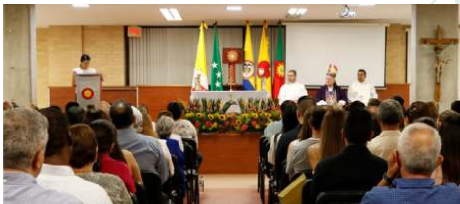
Semana de Acción de gracias