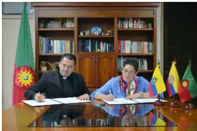
Firma de convenios